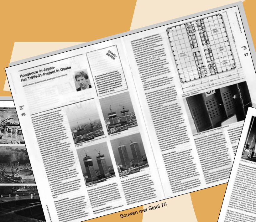
Bouwen met Staal 75