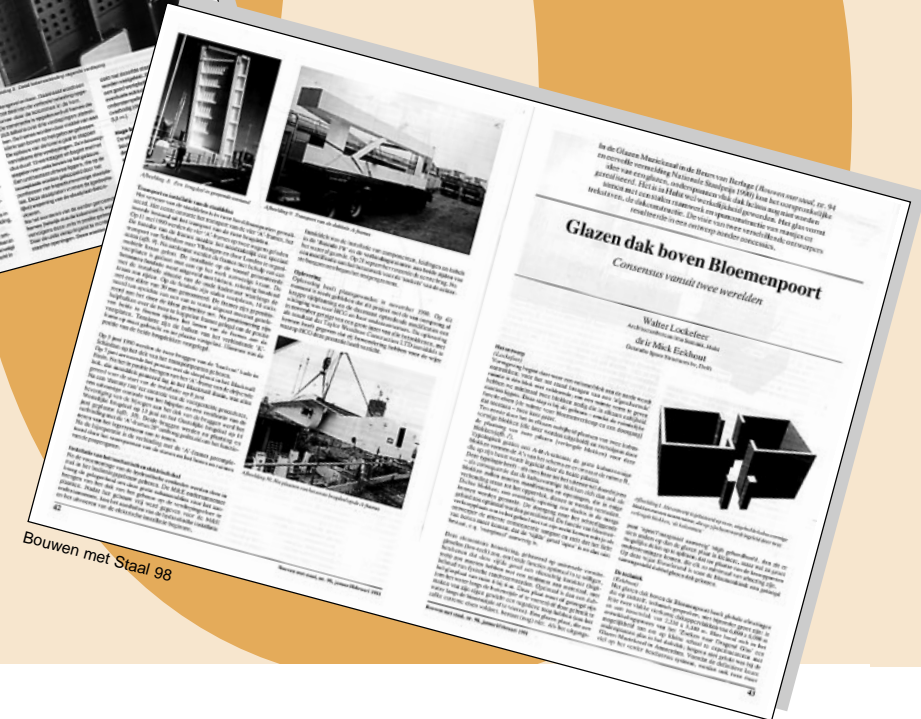
Bouwen met Staal 98