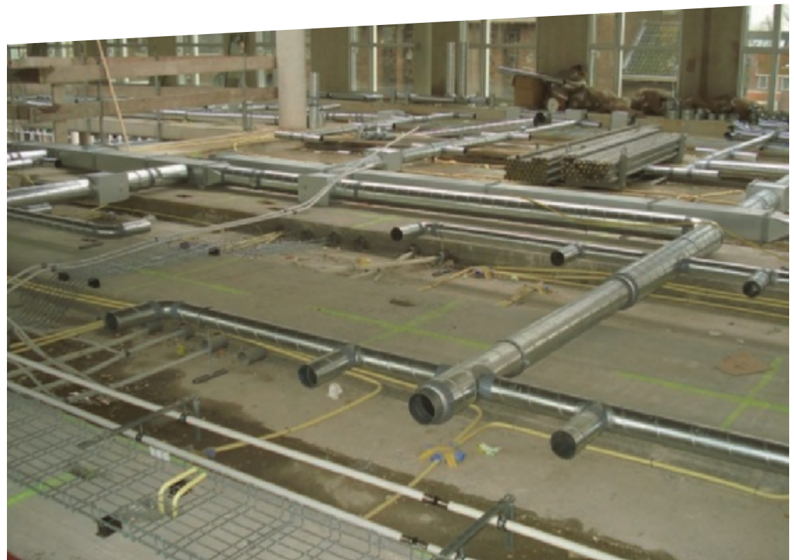
Gemeentehuis Zwijndrecht: integratie constructie met installaties

Reageren? Mail naar duurzaambeton@ cementonline.nl.