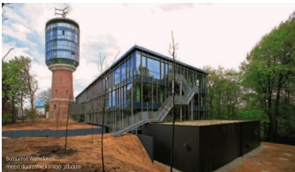
Bussumse Watertoren: meest duurzame kantoorgebouw